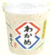
カップみそ汁(わかめ) 本体価格 130円(税込140.40円)