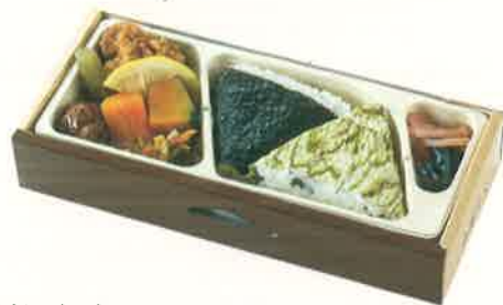
おにぎり弁当 2ヶ入