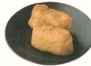
蓮いなり天下様 4ヶ入