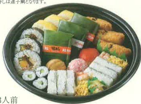
[小] 3人前 直径28.5cm / お箸・お手拭 3本入 本体価格 1,850円(税込1,998.00円) ※「かっぱ巻き」はわさびが入っていません。 ※鯛の笹寿司は連子鯛となります。