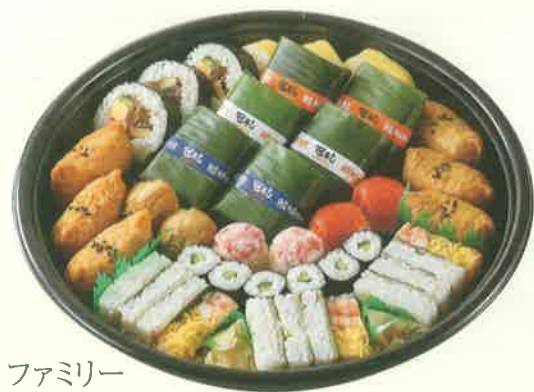
ファミリー [大] 5人前 直径37.5cm / お箸・お手拭 5本入 本体価格 3,000円(税込3,240.00円) ※「かっぱ巻き」はわさびが入っていません。 ※鯛の笹寿司は連子鯛となります。