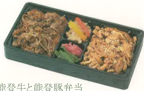
贅沢能登牛と能登豚弁当