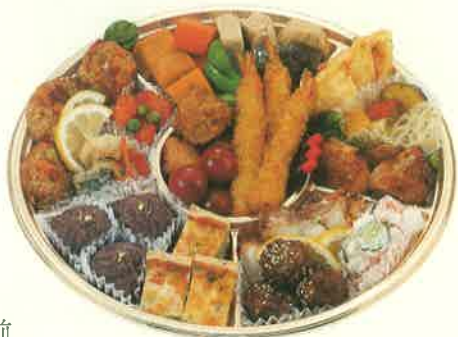
[小] 3人前 直径 31cm / お箸・お手拭 3本入 本体価格 3,000円(税込3,240.00円) ※土曜・日曜・祝日限定予約