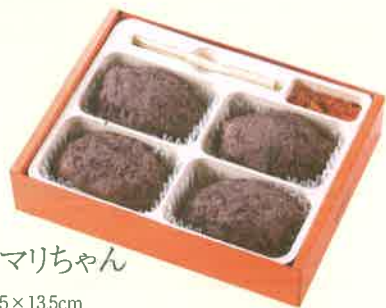
おはぎのマリちゃん 4ヶ入 17.5×13.5cm 本体価格 440円(税込475.20円)