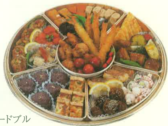
オードブル [大] 5人前 直径 41cm / お箸・お手拭 5本入 本体価格 5,000円(税込5,400.00円) ※土曜・日曜・祝日限定予約