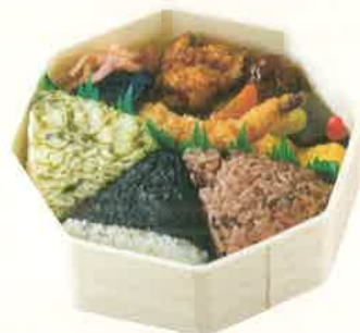
おにぎり弁当 3ヶ入